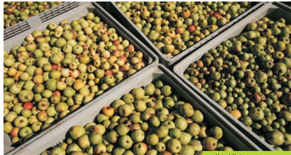
Uzta-bilketa – cosecha

Paseoan barrena, gizakiak duela zenbait mendez geroztik inguru oso emankor bilakatu duen erribera lurra zeharkatzen da. Izan ere, XVII. mendearen amaieratik aurrera, padurak intentsiboki lehortu ziren eta, hartara, ihitzak landu ziren. Horri esker, nekazaritza-ekoizpena handitu egin zen, batez ere, Ameriketatik ekarritako labore berriena, hala nola, artoarena. Gaur egun, berriz, baratzeak eta fruta-sailak daude lur hauetan, eta sagarrak eta kiwiak dira nagusi.