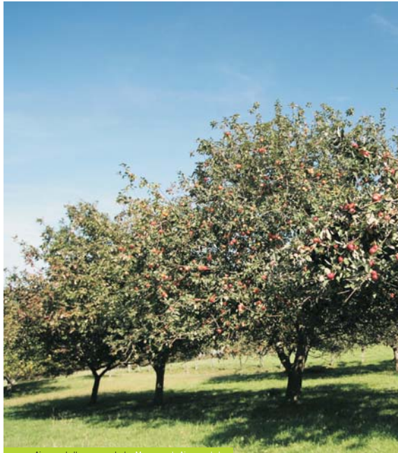
Aizarnazabalko sagarrondoak – Manzanos de Aizarnazabal