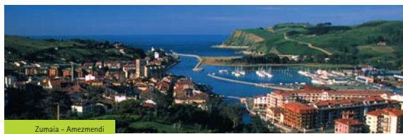
Zumaia - Amezmeni

En el paseo recorreremos una llanura aluvial que la mano del hombre ha venido transformando desde hace siglos para hacer de ella una zona muy productiva. Es a partir del final del siglo XVII cuando se comienzan a desecar de forma intensiva las marismas, lo que posibilita el cultivo de los antiguos juncales. Gracias a ello se consiguió el aumento de la producción agrícola, y especialmente de nuevos cultivos traídos de América como el maíz. Actualmente, tanto huertas como plantaciones de frutales ocupan estos terrenos, y entre estas dominan los manzanos y kiwis. También veremos algunos castaños, cerezos y otros frutales, a la vez que observaremos el cultivo de hortalizas en invernadero, un modo de producción que aumenta paulatinamente.