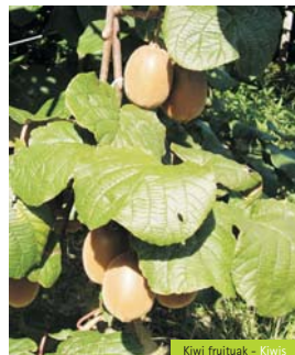
Kiwi fruituak - Kiwis