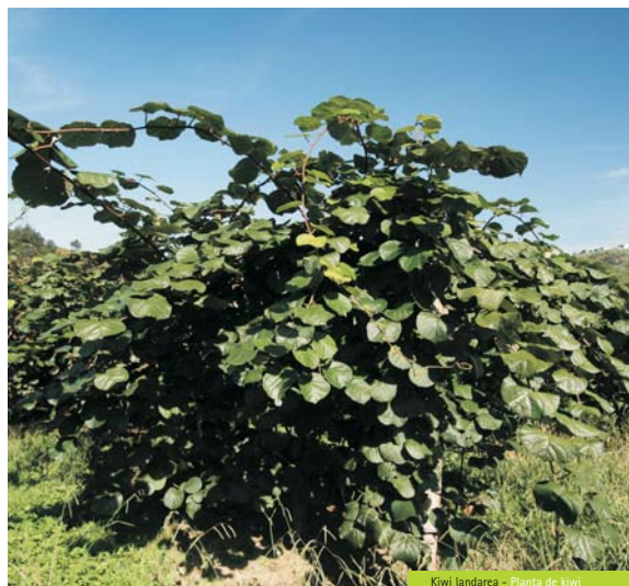
Kiwi landarea - Planta de kiwi

Aizarnazabaldik atera eta lehenengo meandroa pasatu ondoren, arretakin ibili behar gara bidegurutzeetan –Etxabe auzoan dago lehenengoa-, ibilbideari zuzen jarraitzeko. Aurrerago, Oikian, Urola ibaia Mantzísidor zubiaren gainetik zeharkatu behar da eta, aldapa igo ondoren, Arteaga baserriaren parean, Karakas landexerantz jo. Hartara, Santiago hondartzatik eta Zuloaga museotik hurbil egongo gara, eta Zumaia oso gertu.