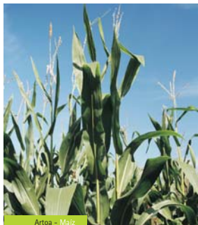
Artoa - Maiz